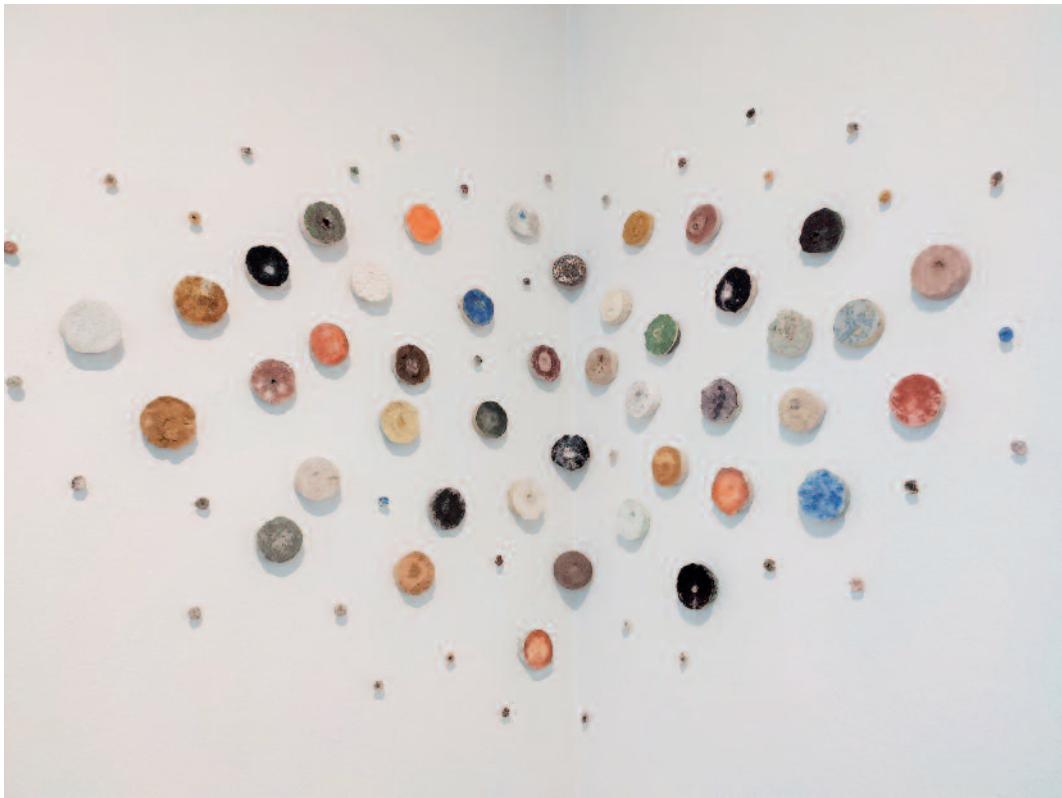
Valentino Berndt, Erosionsobjekte, 2018, Erosionstropfen 2020, gemischte Materialien