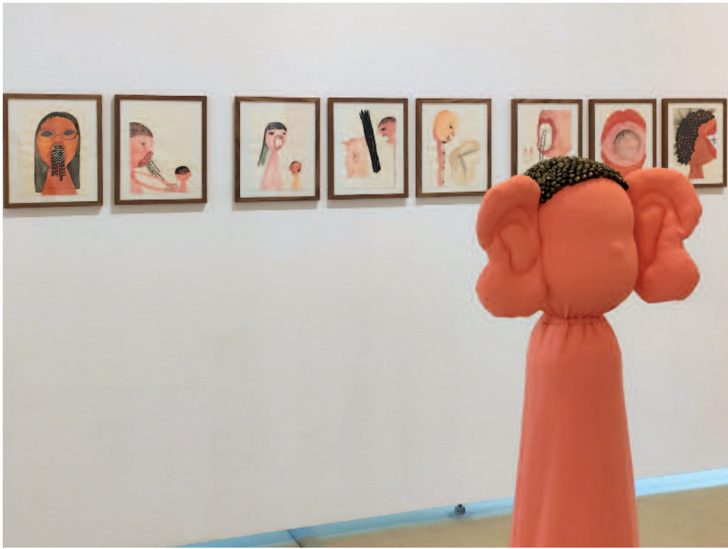
Suah Im, Rauminstallation, Im Vordergrund „Ein Zuhörer und ein Sprecher“, rotierende Puppen, mixed media, 2022