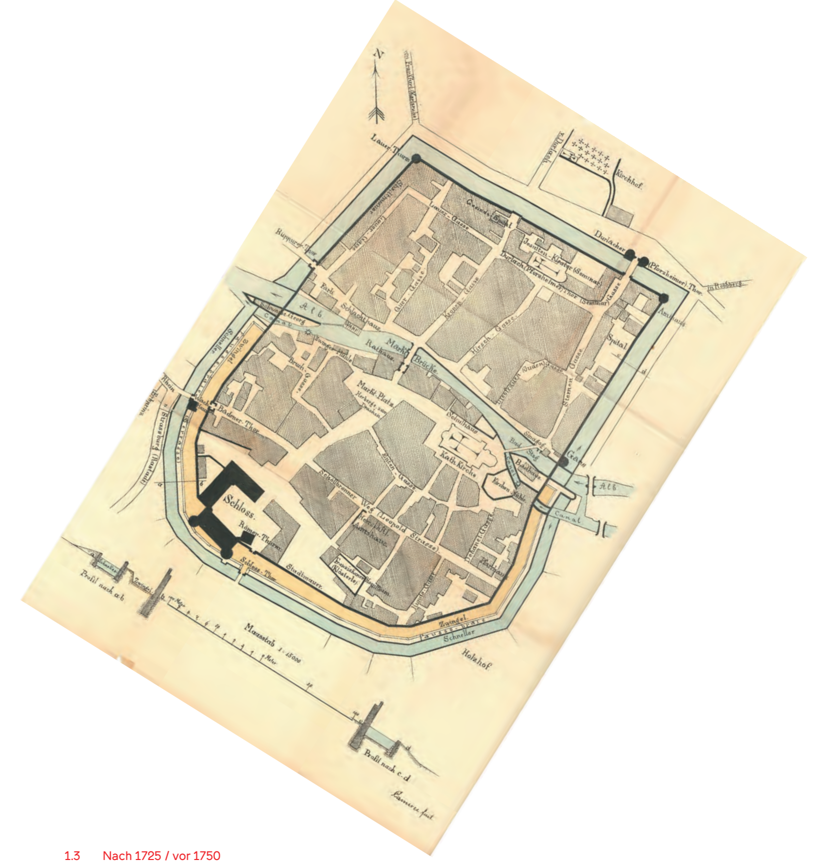
13 Nach 1795 / vor 1750