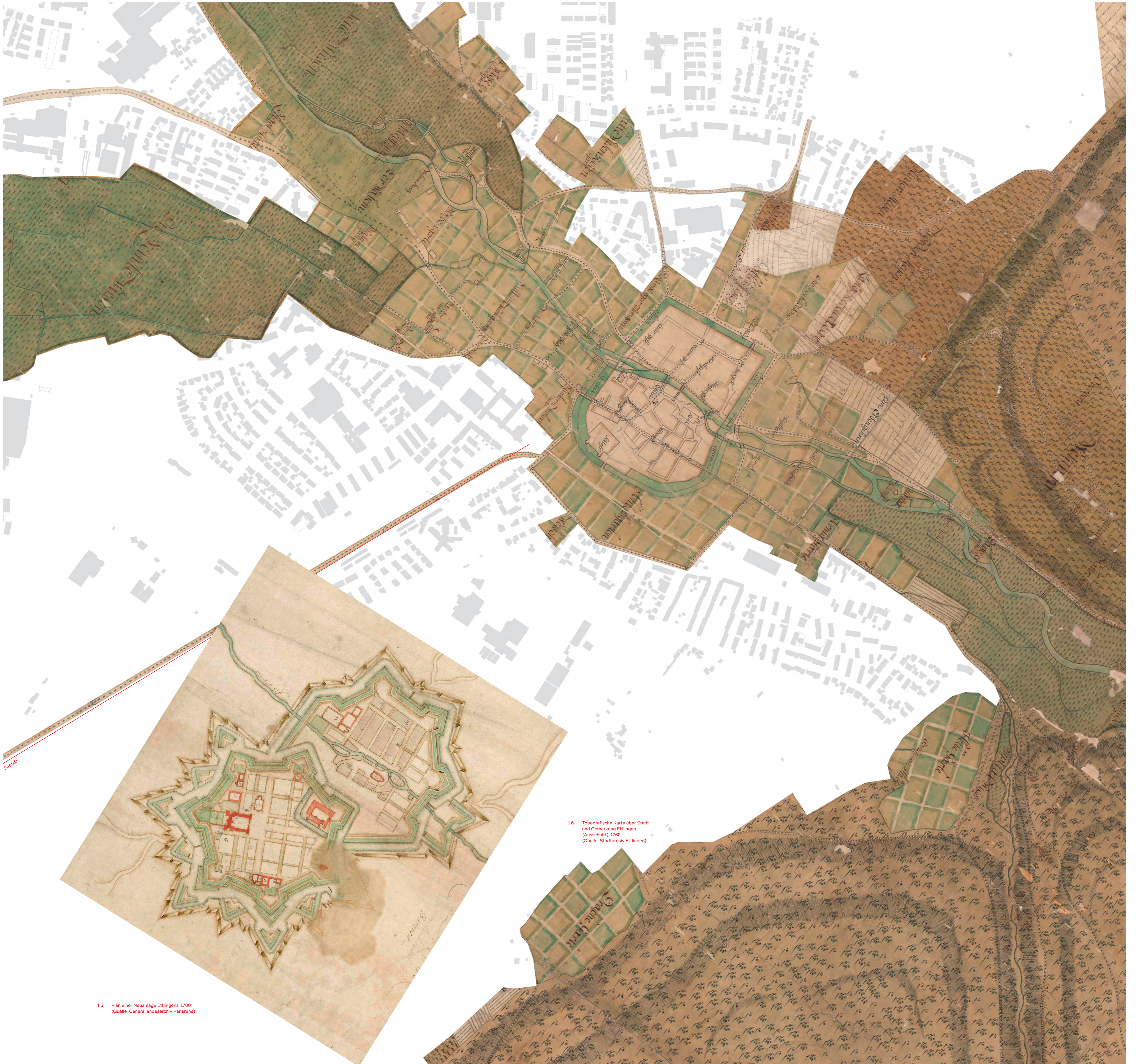
15 Plan einer Neuanlage Ettlingens, 1700