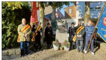
Kranzniederlegung zum Volkstrauertag

Einen recht herzlichen Dank an dieser Stelle an die Abordnung der Fahnenträger und die Fackelträger der Freiwilligen Feuerwehr Oberweier.