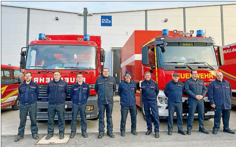
Mit den anderen Kameraden der Landkreis-Wehren haben sich sechs Ettlinger Feuerwehrmänner der Kernstadtwehr auf den Weg an die ukrainische Grenze gemacht.

Die Pakete aus Hilfsgütern werden seit Tagen vorbereitet, verpackt und in drei Sprachen beschriftet: Deutsch, polnisch, ukrainisch. Zahlreiche ehrenamtliche Helfer sowie Mitarbeiter des Landratsamtes Karlsruhe und der Feuerwehren im Landkreis Karlsruhe sind im Einsatz für eine Spendenaktion. Am Freitag vergangener Woche ist der Konvoi aus sieben Feuerwehr-Fahrzeugen in Bruchsal