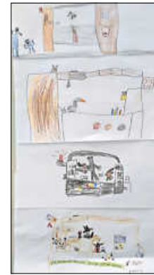
Kinder malen das Theater

Alle drei ersten Klassen besuchten in den letzten beiden Wochen das Himmelreicher Puppentheater in Karlsbad. Dazu fuhren sie mit der Bahn von Ettligen nach Langensteinbach.