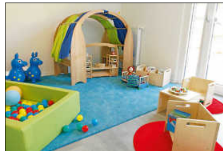
Anton Tiger Schöllbronn