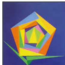
Vernissage „Frühlingsgefühle“ Foto: E. Nüchtern

Farb-Kunst bringt Frühling ins Begegnungszentrum. Leuchtend, strahlend, farbenfroh sind die Bilder von ELISABETH NÜCHTERN.