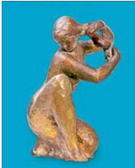
Ab Sonntag, 14. April zeigt das Museum Werke des Künstlers Karl Albiker.

Das Thema der Ausstellung „Figur und Raum“ reflektiert die jahrzehntelange künstlerische Auseinandersetzung des Bildhauers Karl Albiker mit den Beziehungen und Wechselwirkungen der Figur zu dem Raum, der sie umgibt. Albiker setzte sich neben der künstlerischen Arbeit auch theoretisch in einigen Aufsätzen mit diesem Thema auseinander. Die Summe seiner Überlegungen fand Niederschlag in der erst postum veröffentlichten Schrift „Das Problem des Raums in den Bildenden Künsten“.