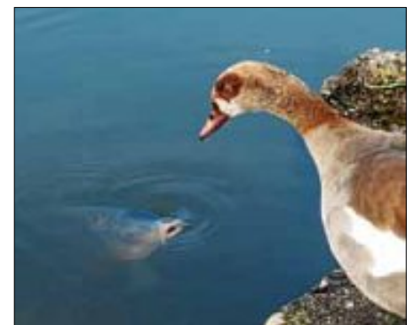
Tierisch-wild: Romeo alias Fred und Julia alias Frieda am Horbachsee in trautem Tete-à-Tete ...