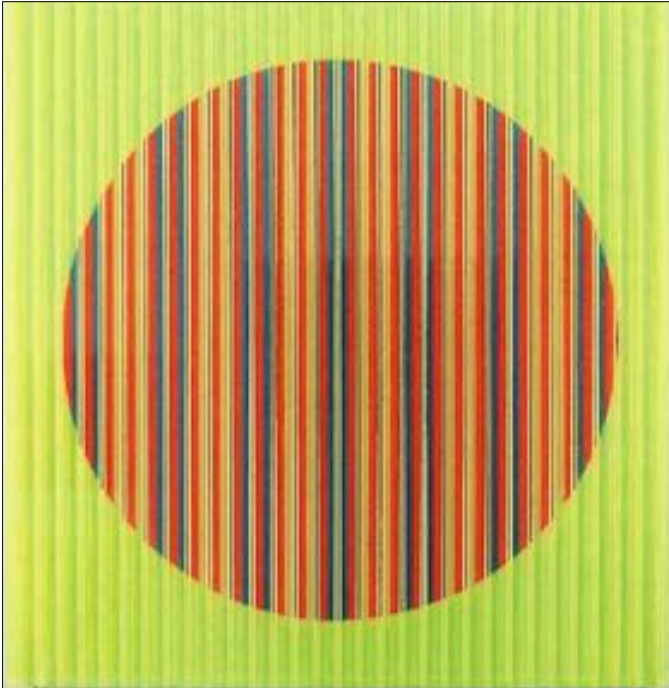
Werke von Norbert Huwer sind seit dem 1. Oktober in der Städtischen Galerie des Museums zu sehen.

Die Ausstellungsprogrammatische des Museums sieht eine zentrale Aufgabe darin, das Arbeiten und Wirken einzelner, herausragender Künstlerpersönlichkeiten, die in der hiesigen Kunstszene verwurzelt sind und diese mit prägen, der Öffentlichkeit zu präsentieren.