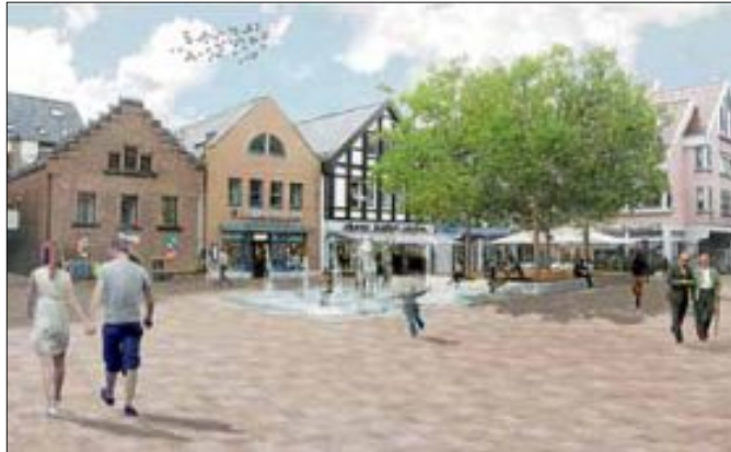
So könnte der Neue Markt künftig aussehen. Entwurf: faktorgruen