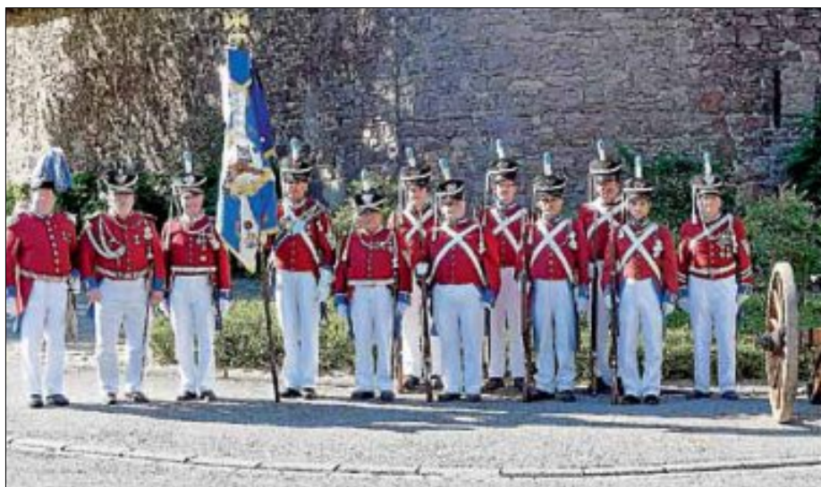
Stadtspaziergang mit uniformierten Gästeführern der Historischen Bürgerwehr Ettlingen e.V.

Am Donnerstag, 19. Juli, um 18.30 Uhr erfahren interessierte Besucher bei einem spannenden Rundgang in der Ettlinger Altstadt Wissenswertes und in Vergessenheit Geratenes von der Bürgerwehr Ettlingen, die 1715 durch Markgräfin Sibylla Augusta gegründet wurde - wo ihr altes Schießhaus war oder wo 1927 die Wiedergründung stattgefunden hat zum Beispiel.