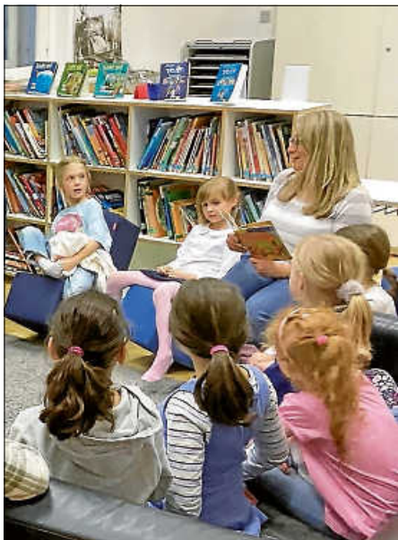
aufmerksame Zuhörer und Zuhörerinnen

Und einige von uns hatten in der Nacht dann tatsächlich fantastische Abenteuer im Traum erlebt. Ob das wohl an den Zauberbohnen lag?