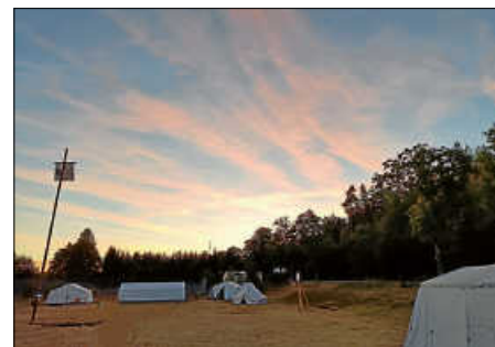
Sonnenuntergang Lager 23