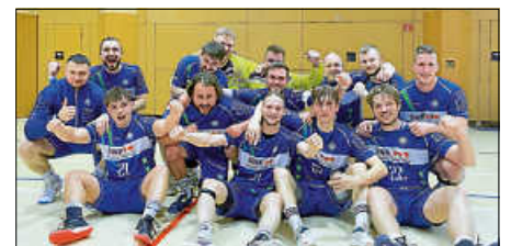
Wichtiger Auswärtssieg in Plankstadt!