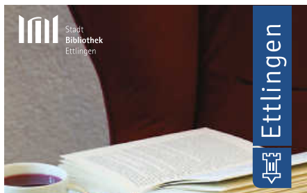
Illustration © Sascha Wustefeld 2024

Gratis Kids Comic Tag in der Stadtbibliothek