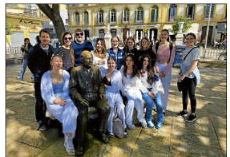
Gruppenbild mit Pablo Picasso

Auch in diesem Jahr konnten wir wieder einen Schüleraustausch mit unserer Partnerschule in Málaga durchführen, auch wenn sie dieses Mal leider nur 10 Plätze anbieten konnte.