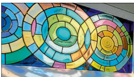
Buntglasfenster im Raum der Stille, Arista Nord.

Viele große und kleine Spender haben bislang ein paar Euros in den Spendentrichter trudeln lassen. Neben der Unterstützung des Arista Nord bereitet es einfach Freude, den Münzen auf dem Weg in den Trichterschlund zuzusehen. Und einen Mordslärm machts zur Gaudi vor allem der kleinen Besucherinnen und Besucher überdies!