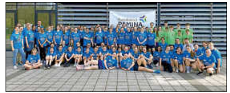
72 Mädchen aus Baden, dem Elsass und der Pfalz kamen am 8./9. April 2024 zum PAMINA-Ballspiel-Cup zusammen

Im nächsten Jahr wird das Eichendorff-Gymnasium zusammen mit der Wilhelm-Lorenz-Realschule Gastgeber für den PAMINA-CUP sein.