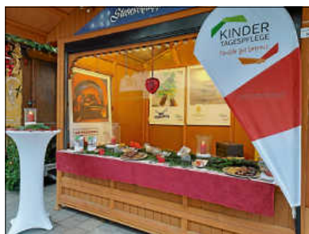
Sternschnuppenhütte des TEV Ettlingen

Am 7.12. war der Tageselternverein Ettlingen und südlicher Landkreis Karlsruhe e.V.