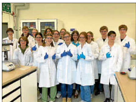
Bio-Grundkurs KS12 beim Praktikum am KIT