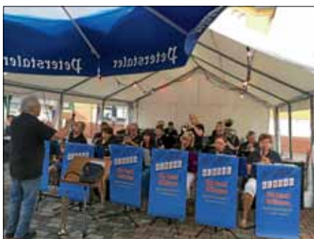
Straßenfest Dorfmusikanten Lingenfeld

Wir beginnen mit den Vorbereitungen zum Marktfest am 17.08. im Proberaum. Fleißige Helfer gerne gesehen.