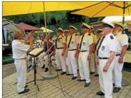
Sommerfest in der Hochmühle