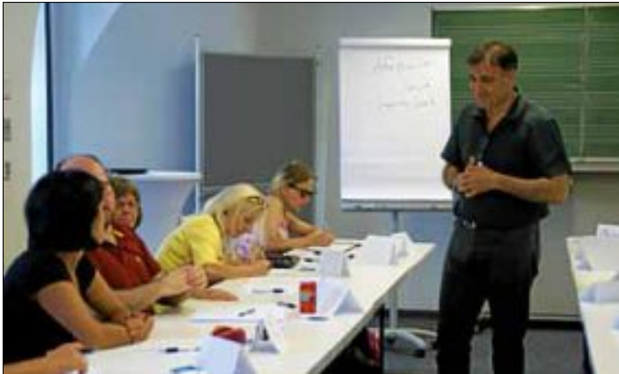
Erfolgreich gestartet ist der Arabischkurs.

„Ich habe syrische Freunde und möchte ihre Kultur besser verstehen“, sagt eine Teilnehmerin. „Ich bin schon oft in arabische Länder gereist, aber ich konnte mich kaum verständigen“, sagt ein anderer Kursteilnehmer. Die Gründe für die Teilnahme am Arabisch-Schnupperkurs im Begegnungsladen K26 sind so unterschiedlich, wie die Teilnehmer selbst. Doch eines haben sie gemeinsam: Die Lust nach kulturellem Austausch und Begegnung.