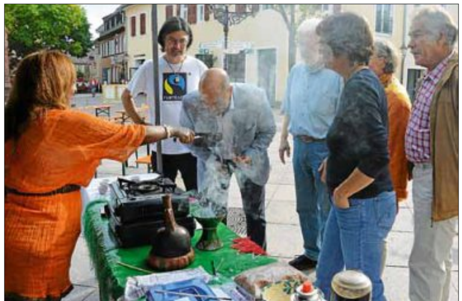
Verlockend riechen die frisch gerösteten Kaffeebohnen.

Weltladen, dem Handel und der Gastronomie, um weitere Ideen zu entwickeln, merkte er mit Blick auf Denise Bonhage vom Stadtmarketing heraus, bei ihr laufen dafür die Fäden zusammen. Bis zum 30. September läuft die Fai-