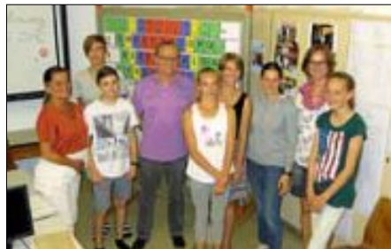
Stolz nahmen die Sieger beim Bundesjugendschreiben die Ehrung für ihre Leistungen vom Stenografenverein Ettlingen entgegen.