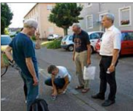
Denk mal! In neuem Glanz präsentieren sich die Ettlinger Stolpersteine.

Bürgermeister Thomas Fedrow zeigte sich sehr erfreut, dass so viele Menschen der Einladung zum Stolpersteinputzen gefolgt sind und sprach dem Ettlinger Bündnis gegen Rassismus und Neonazis seinen Dank für die Organisation des Stolpersteinprojekts aus. Er führte aus, dass auch durch die Putzaktion, durch die wieder im Schein der Sonne glänzenden Stolpersteine, dafür gesorgt werde, dass die Namen der Opfer nicht vergessen sind.