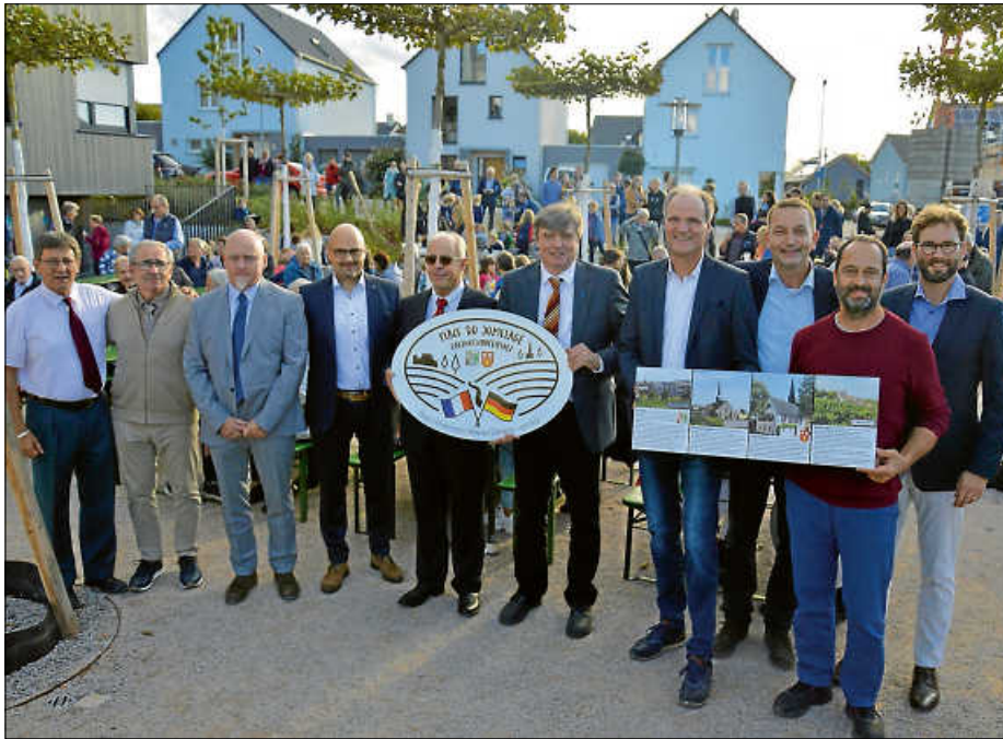
Bei der Einweihung der „Place du Jumelage“ in Oberweier.

Im Dezember vergangenen Jahres ging mit der Übergabe des Seniorenwohnhauses im Neubaugebiet Gässeläcker ein langgehegter Wunsch des Ortschaftsrats in Erfüllung. Und ein Dreivierteljahr später konnte nun auch der Quartiersplatz und der Gemeinschaftsraum eröffnet werden.