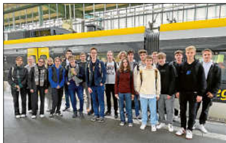
Das Geschichtskurs g-3 der KS 11 auf Exkursion nach Stuttgart ins Haus der Geschichte

Beeindruckt von der Fülle der Informationen und Anregungen, traten wir nach einer kurzen Mittagspause den Heimweg an.