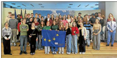
Die Teilnehmenden des Erasmus+ Projekts aus Dublin und Ettlingen zu Gast bei der Vertretung des Landes Baden-Württemberg bei der Europäischen Union

Wir freuen uns auf die nächste Begegnung mit unserer irischen Partnerschule entweder in Ettlingen oder Dublin. Weitere Informationen über die Erasmus+ Projekte am AMG finden Sie unter: https://amgettlingen.de/lernen-am-amg/erasmusplus .