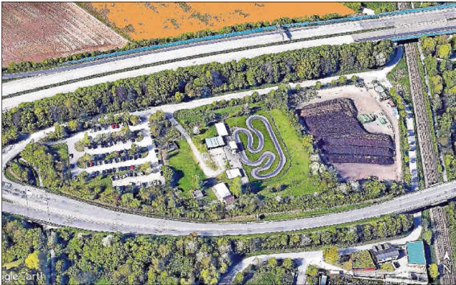
Die Eiswiese/Minidrom könnte für eine Biogasanlage ein möglicher Standort sein.