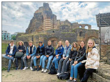
Besuch der Kaiserthermen in Trier