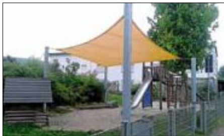
Spielplatz „Am Sang“

Pünktlich zur Sommerzeit werden zwei neue Sonnensegel für unsere Kleinsten erstellt – eines „Am Sang“ und eines in der Fère-Champenoise-Straße. Sie sollen an heißen Tagen für etwas Schatten sorgen.