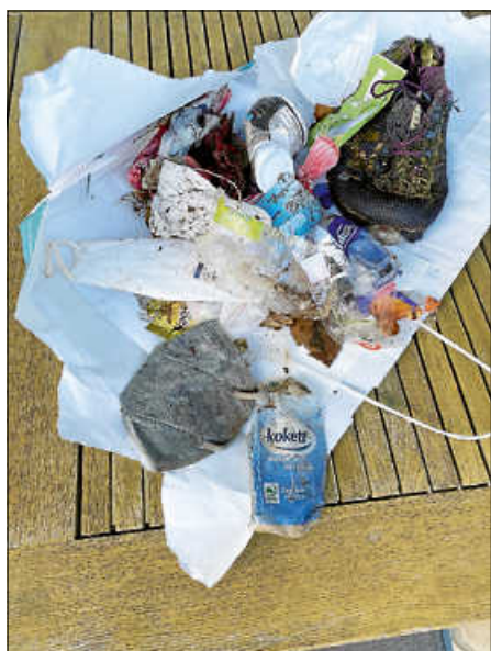
Wilder Müll, im Wald gesammelt