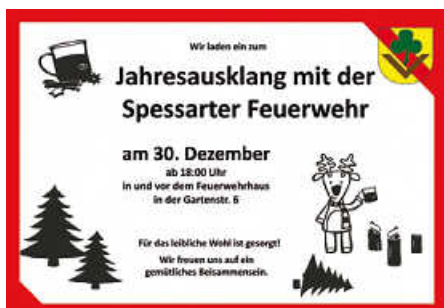
Flyer: S. Fischer

Die Freiwillige Feuerwehr in Spessart lädt ein zum offenen Jahresabschlussfest. Am Samstag, 30. Dezember, ab 18 Uhr heißen wir