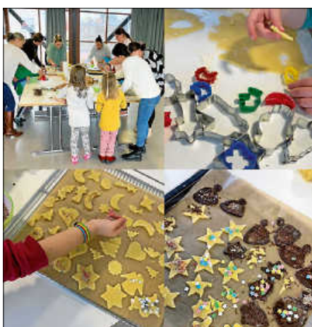
Plätzchen backen im Kindergarten

Am 8. Dezember durften die Spessarter Kindergartenkinder wie in jedem Jahr wieder gemeinsam mit dem Förderverein und helfenden Eltern leckere Plätzchen backen. Hierbei wurde fleißig Teig ausgerollt, Sterne, Herzen und Engelchen ausgestochen und dann – die Lieblingsaufgabe fast aller Kinder – mit reichlich Schokostreuseln und bunten Zuckerperlen dekoriert.