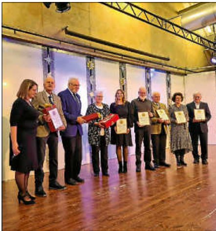
Ehrungsreigen bei der Germania

Mit einer kleinen Dia-Show zur Vereinsgeschichte klang der Abend aus.