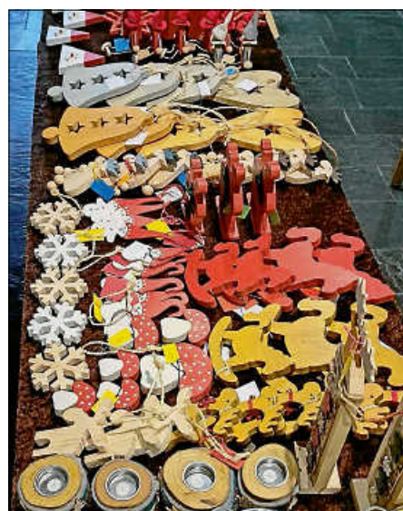
Schönes für den Gabentisch

Sie suchen noch ein kleines Geschenk zu Weihnachten oder einen Schal oder Deko fürs Weihnachtsfest oder selbstgebackene Plätzchen? Dann bietet sich am kommenden Sonntag, 17. Dezember, nach dem Gottesdienst nochmal die Gelegenheit. Mit Ihrem Erwerb unterstützen Sie Hilfsprojekte in unserer Region. Wie z. B. den Karlsruher Kindertisch oder den Kinderhilfefond des Diakonischen Werkes Karlsruhe.