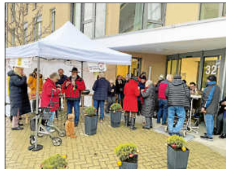
Bei Glühwein und Gebäck ließen es sich Bewohner, Gäste und die Nachbarschaft gut gehen.

Im Frühjahr wird es erneut eine „Begegnung im Quartier“ geben.