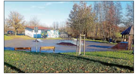
Skaterplatz in Bruchhausen