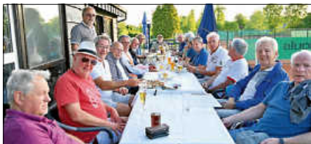
Entspannte Stimmung auf der Clubhusterasse

Die hohen Temperaturen und kräftige Windböen setzten allen Spielern zu, so dass der Flüssigkeitsverlust während und nach den Spielen ausgeglichen werden musste. Auch der Kalorienverbrauch forderte seinen Tribut. Da waren wir bei unserem Da Pino aber bestens aufgehoben und alle haben feine Pasta und Pizza genossen – auch die mitgereisten Fans aus Schöllbronn. Fazit: Es war ein anstrengender, aber wunderschöner Tennistag unter Tennisfreunden, der nach einer Wiederholung ruft. Die Einladung haben wir schon bekommen: auf ein Neues im Herbst in Schöllbronn.