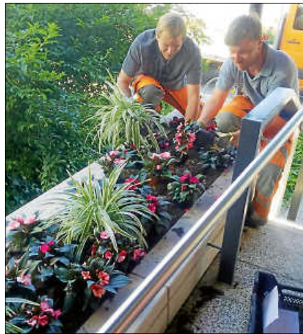
Blumengruß im Eingangsbereich der Ortsverwaltung - Dank an unsere Stadtgärtnerei