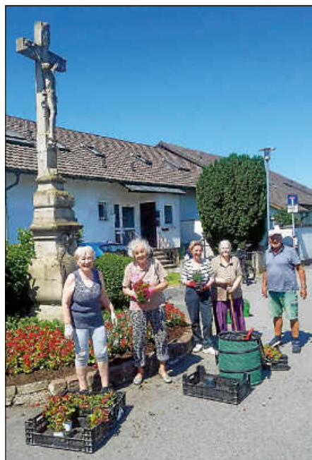
Blumengruß am Kreuz Durmersheimer Straße/Herbststraße - Dank an unseren Obst- und Gartenbauverein für die Übernahme der Patenschaft