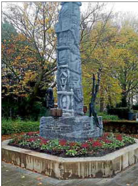
Das Kerneier Denkmal in Arbeit

Die Friedhofsbesucher werden es bereits gemerkt haben: Am Kerneier Denkmal wird gearbeitet. Hintergrund ist die Sanierung der in die Jahre gekommenen Natursteineinfassung um das Denkmal. Die Stellplatten und die Deckplatten hatten sich gelöst und müssen nun neu verlegt werden. Das Denkmal ist im Eigentum der Stadt und wurde seinerzeit von den ehemaligen Kerneiern finanziert und an die Stadt Ettlingen übergeben. Im Vorfeld wurde das Granitdenkmal bereits abgestrahlt. Bald wird das für Bruchhausen bedeutende Denkmal in neuem Glanz erstrahlen.