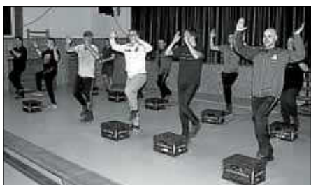
Übung macht den Meister

Und du? Hast du Lust am „Tanzen“ innerhalb einer coolen Truppe? Das Pilsrudel trainiert donnerstags um 19:30 Uhr im Spechtwaldsaal. Herzliche Einladung!