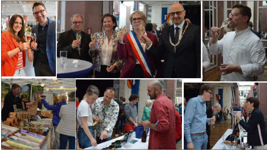
Entspannt ging es auf dem 8. Champagnerfest in der Schlossgartenhalle zu, wo es Perlend-Prickelndes gab und draußen wartete der französische Markt mit weiteren Spezereien auf.

Um es gleich vorwegzunehmen, einen Ticketverkauf mit Zeitfenstern einzuführen, war die richtige Entscheidung. Denn im vergangenen Jahr war wegen Überfüllung ein entspanntes Degustieren kaum möglich.