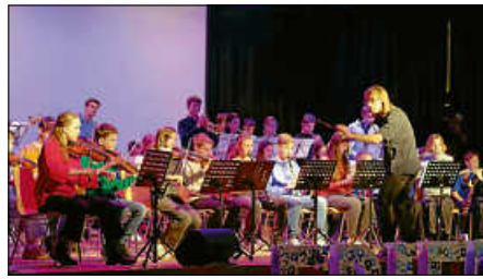
Stimmungsvolle Klänge mit dem eigens gebildeten Schulorchester

Den Festakt eröffnete das eigens für dieses Event zusammengestellte 50-köpfige Schulorchester mit der Eurovisions-Hymne, gefolgt von Klängen der Filmmusik aus „Fluch der Karibik“.