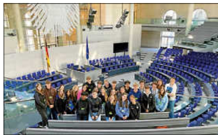
Die 10c auf der Besuchertribüne des Plenarsaals

Danach fuhren wir mit der U-Bahn zurück in unsere Unterkunft, wo wir unsere Zimmer bezogen und ein leckeres Abendessen mit Nachtsch genießen konnten.