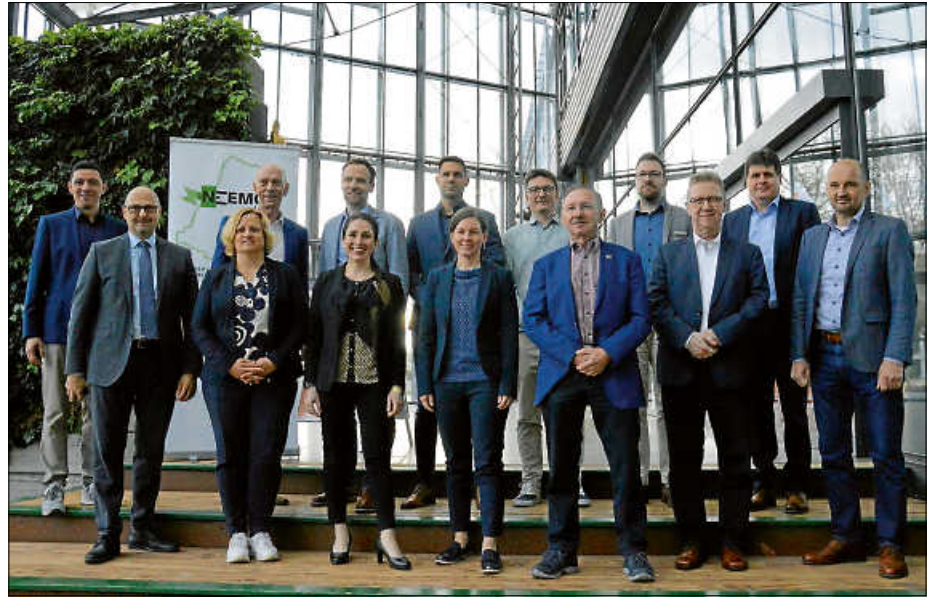
Am Dienstag vergangener Woche wurde von Vertretern von zwölf Städten, Stadtwerken und Energieagenturen die Willensbekundung für NEEMO unterzeichnet im Grünhaus der Stadtwerke