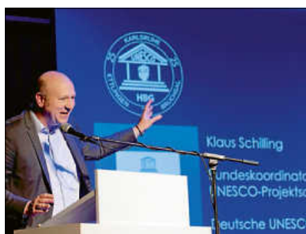
Klaus Schilling, Bundeskoordinator der UNESCO-Projektschulen Deutschland

Die kulturelle Vielfalt wurde sogleich durch eine kleine Zeitreise veranschaulicht, indem die ehemaligen und aktuellen UNESCO-Bauftragten der Schule über die Anfänge des Indien-Austausches im Jahr 1993 erzählten und Einblicke in die aktuelle Situation der Heisenberg-Partnerschule in Mitraniketan gaben.