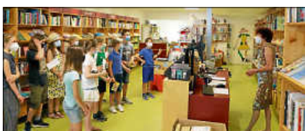
Die 5e im Abraxas