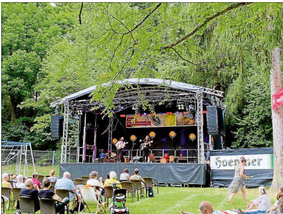
Müßiggang im Grünen: wer den Weg in den Watthaldenpark fand, wurde mit entspanntem Live-Musik-Genuss belohnt.

Lediglich die letzte Band konnte wegen der Sturmwarnung nicht mehr auftreten, sie wird dafür beim 28. WatthaldenFestival im nächsten Jahr spielen.