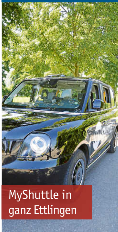
MyShuttle in ganz Ettlingen