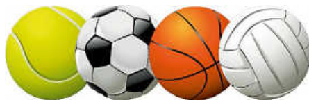
symbolische Darstellung verschiedener Bälle Grafik: Mario Graetz

Der VC Ettlingen erweitert (Beginn nach den Osterferien) sein Angebot für junge ballbegeisterte Sportlerinnen und Sportler: Angelehnt an die Konzepte der Ballschulen (Heidelberger Ballschule, ABC des Spielens) möchten wir eine allgemeine sportartübergreifende Sportstunde anbieten, um die Kinder an Rückschlag-, Schuss- und Wurfsporarten heranzuführen. Mit einem vielfältigen Programm werden neben Ballgefühl und -koordination auch motorische und emotionale Fähigkeiten gefördert, die in Mannschaftssportarten ganz besonders gefragt sind.