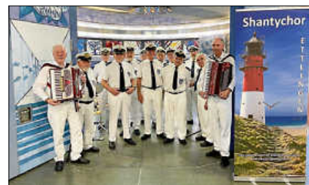
Zum ersten Mal in St. Martin in Forchheim: Der Shantychor

Kommen Sie zu uns, singen Sie mit. So können Sie sich und anderen Freude bereiten. Mehr unter: mk-ettlingen.de