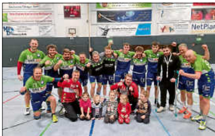
Unsere Herren 3 feiern den MEISTERTITEL!

Nebst des Herren-1-Verbandsligaspiels in Ispringen fanden in der heimischen Franz-Kühn-Halle die letzten Saisonspiele unserer Jugendteams statt. Diese konnten fast alle gewonnen werden und führten somit zu einem versöhnlichen Abschluss der Saison. Lediglich unsere männliche D-Jugend verlor mit 19:22 gegen das Team der SG Stutensee/Weingarten und verspielte damit auf der Zielgeraden die Meisterschaft in der Bezirksklasse. Aber ein zweiter Platz ist auch nicht schlecht und belohnt die sehr gute Saisonleistung des Teams.