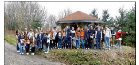
Schüleraustausch Epernay

Am 23. März haben sich 43 Schüler und vier Lehrer zusammen mit fünf Betreuern des DAV Ettlingen am Kreuzenberg auf eine „Schatzsuche“ begeben. In drei Gruppen musste anhand einer Planskizze auf drei unterschiedlichen Routen das Ziel gefunden werden. Tatsächlich haben dann auch alle Gruppen nach etwa 3,5 km die Hanessenhütte oberhalb von Ettlingen erreicht. Jetzt galt es, die im Wald versteckte „Schatzkiste“ zu finden. Sehr bald haben die Schüler sie in einem Baum hängend entdeckt und geborgen.