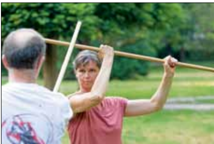
Stockkampf im Park

Rege besucht war diesen Sommer unser Stocktraining im Park. Weil die Sporthallen in den Ferien leider geschlossen sind, traf sich die Aikidogruppe jeden Montag Abend im Park hinter der Herz-Jesu -Kirche. Das Wetter war natürlich traumhaft und in den Abendstunden schon angenehm kühl. Das schöne Ambiente unter den alten schattigen Bäumen macht es uns nicht leicht, bald wieder in der Halle zu trainieren. Am Montag, 10. September, 19 Uhr geht es wieder los mit Aikido im Eichendorff-Gymnasium und mittwochs um 19.30 Uhr in der Wilhelm-Lorenz- Realschule. Wer Lust hat, sich Aikido mal anzuschauen, kann gerne vorbeikommen.