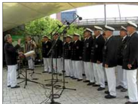
HafenKulturFest Karlsruhe: Immer dabei - der Ettlinger Shantychor