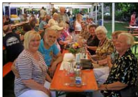
Das Bild zeigt: den Tisch der „Weststadlerchen“ und einige Besucher.