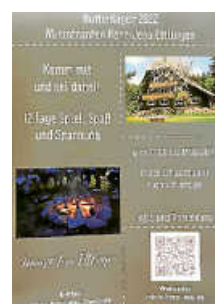
Plakat: Seelsorgeeinheit Ettlingen Stadt

Endlich ist es wieder so weit – es ist Lagerzeit!