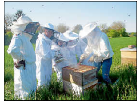
In voller Montur: die neue Bienen-AG auf der Streuobstwiese

geben. Sie zum Bestäuben der Bäume auf die Wiese zu schicken, sollte dank der Bienen-AG aber auch in Zukunft nicht nötig sein.