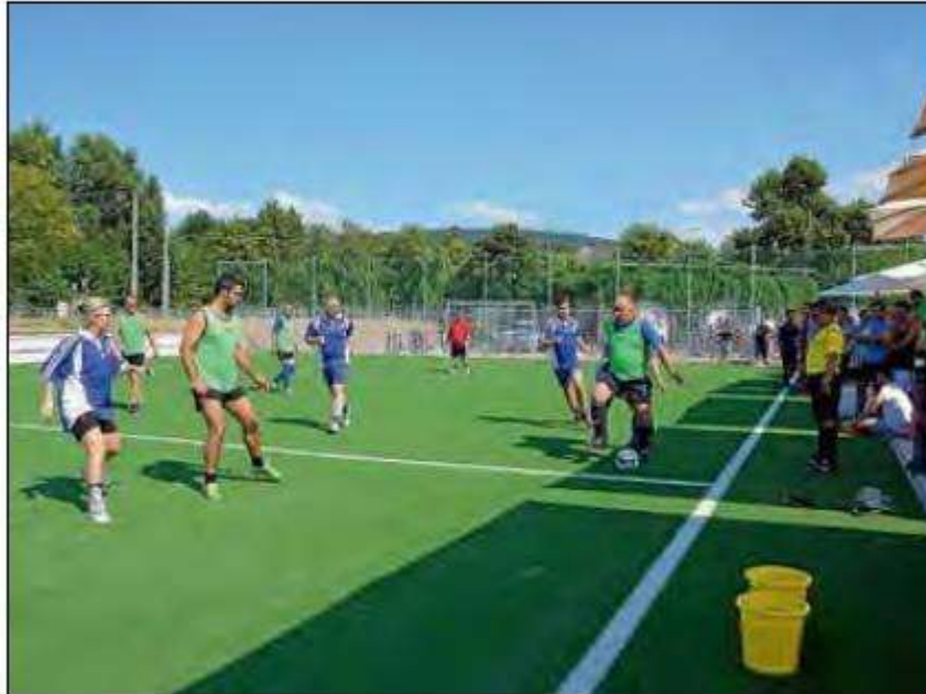
Die Hitze konnte ihnen nichts anhaben, beim Eröffnungsturnier ließen die Frauen und Männer den Ball auf dem neuen Bolzplatz tanzen.

Die Hitze konnte den Frauen und Männern der acht Mannschaften am Freitag vergangener Woche fast nichts anhaben. Sie sausten über den neuen Bolzplatz am Wasen und lieferten sich packende Zweikämpfe, dass es für die Zuschauer unter den Sonnenschirmen ein Genuss war. Ein Genuss sei es auf dem Platz zu spielen, so die einhellige Meinung aller Fußballspieler, die sich mit Eiswürfel und kaltem Wasser direkt aus der Alb wieder auf Normaltemperatur brachten.