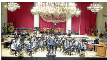
Konzert Baden-Baden - Kurhaus

Lassen Sie sich überraschen. Dieses Bild entstand vor einiger Zeit bei einem schönen Konzert im Bénazetsaal des Kurhauses Baden-Baden.