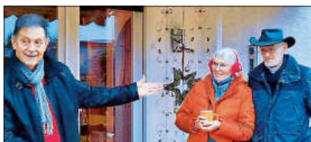
Neue Leitung Boule-Gruppe

Er bereitete allen Boulern einen wundervollen Nachmittag. Der Abend klang sehr gelungen unter weihnachtlicher Stimmung aus.