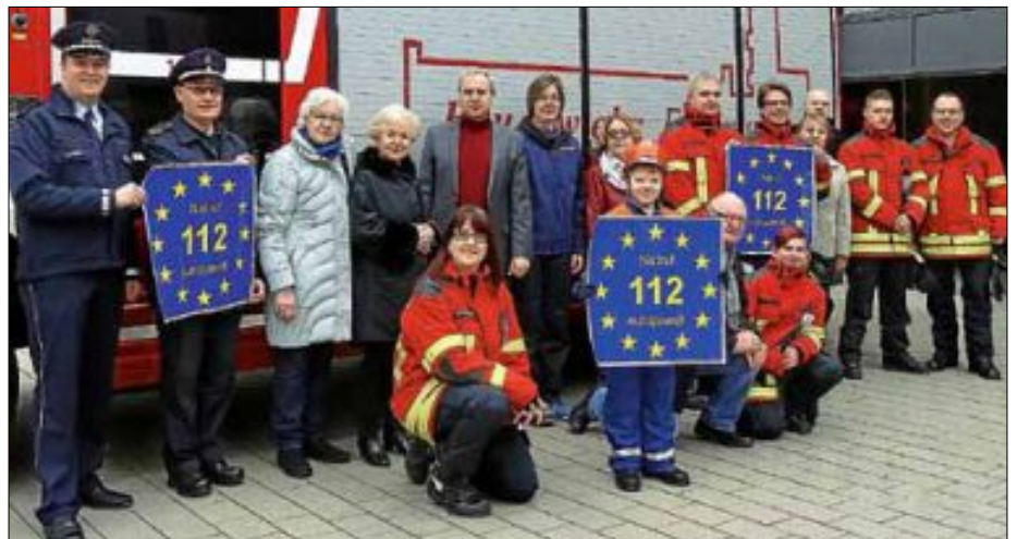
Haupt- und Ehrenamtliche am europaweiten Notruftag am 11.2.