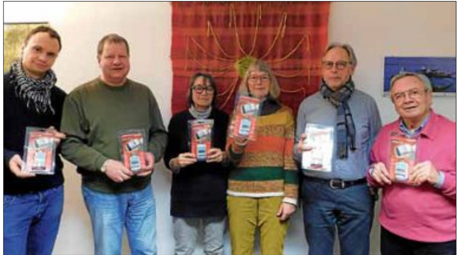
Mitglieder des Arbeitskreises Klimaschutz mit den neuen Heizkörperthermostaten für den Paulus-Kindergarten.

Gemeinsames Projekt von Klimaschutzmanagement, Evangelischer Kirchengemeinde und BUND