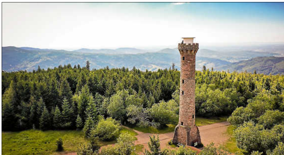
Der Hohlohturm liegt auf der Westwegroute und erlaubt weite Blicke ins Land.

Nach fast vier Jahren Produktionszeit ist die aufwändige Naturdokumentation entlang des Westwegs im Schwarzwald ab 4. Februar auch in der Kulisse Ettlingen mit zahlreichen Vorstellungen zu sehen.