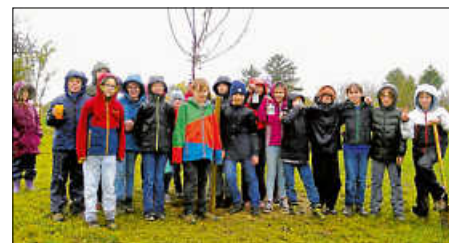
Die 5e nach dem Pflanzen des Baumes

ständigen und kalten Novemberregen geworden waren. Glücklicherweise und mit reichlich Matsch an den Stiefeln trat die Klasse den Heimweg an.