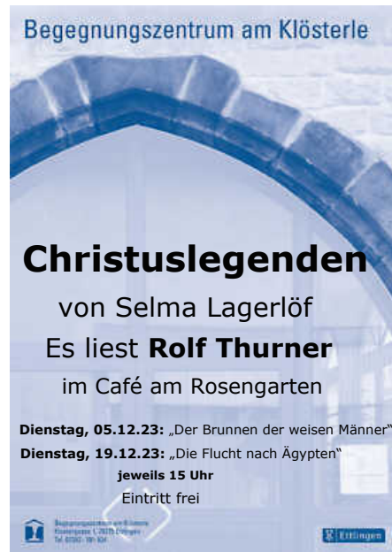
Plakat: A.-B. Brandel

Wegen der Weihnachts-Schulferien (22.12.-7.1.2024) ist die Sporthalle geschlossen. Letzte Trainingsmöglichkeit, Donnerstag, 21.12. und 1. Trainingstag wieder Montag, 8.1.