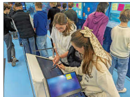
Ein Truck voller Technologien bot 3 Tage lang für die Schüler:innen des AMGs einen Einblick in MINT-Berufe und die digitale Arbeitswelt.

Yvette, Lara und Joscha, Schülerzeitung Furunkel