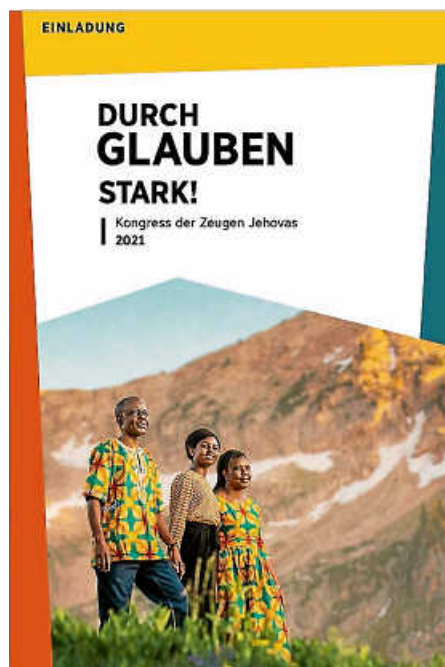
Einladung Kongress 2021

Regionaler Kongress Jehovas Zeugen in Ettlingen beteiligen sich an weltweiter Einladungsaktion zu ihrem virtuellen Kongress 2021 mit dem Motto: „Durch Glauben stark!“.