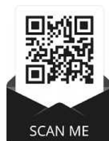
Kongressseite Code: JZ

Aber wie kann man so einen Glauben entwickeln und wie bleibt er stark? All das erfahren Sie auf dem Kongress der Zeugen Jehovas 2021.