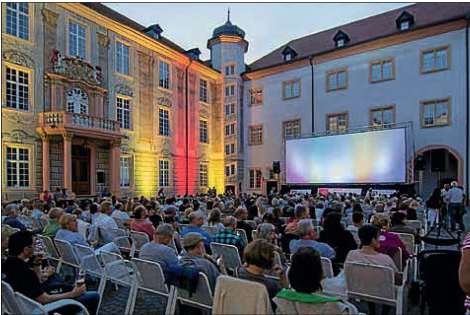
Lauschig-stilvolle Kinoabende kann man wieder ab dem 28. August im Schlosshof erleben.

13 Abende lang gibt es in Ettlingen wieder den wunderbaren Mix aus Schlosshof und Sternenhimmel, musikalischem Warm-up und genialen Filmhits.