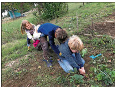
Kinder beim Unkrautziehen

Nach langer Sommerpause hat sich am vergangenen Samstag wieder die Naturkindergruppe des Obst- und Gartenbauvereins Oberweier getroffen. Es gab natürlich wie jedes Mal einiges zu tun. Und trotz der langen Sommerferien haben die Kinder sofort fleißig begonnen, die üblichen Gartenarbeiten zu erledigen. Von Mal zu Mal werden die Kinder routinierter und auch zunehmend ausdauernder in ihrer Arbeit. Das Unkraut wurde schwer bekämpft. Und war der ungebetene Gast auch noch so stark verwurzelt, wurde er mit großem Einsatz und Teamwork ausgerissen.