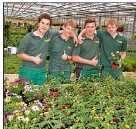
Stolz präsentieren die Auszubildenden der Gärtnerei die Ergebnisse ihrer Arbeit.

Die Lehrlinge der Gärtnerei sowie alle weiteren Jugendlichen, die zurzeit im St. Augustinusheim leben, freuen sich auf das Kommen zahlreicher Gäste, auf die ein reichhaltiges Angebot an Beet- und Balkonpflanzen, Gemüse- und Sommerpflanzen und natürlich auch Kräutern wartet.