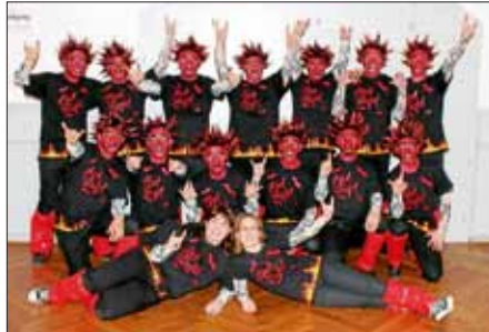
Das Männerballett der Moschdschelle in der Kampagne 2012/2013

Es hat allen wieder viel Spaß gemacht, Glückwunsch und herzlichen Dank für die Teilnahme aller Männerballetts, wir würden uns freuen, wenn alle nächstes Jahr wieder mit dabei wären. Ein extra Dank geht natürlich auch an alle fleißigen Helferinnen und Helfer.