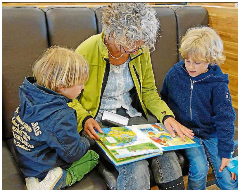
Beliebte Beschäftigung von Leih-Omas und -Enkeln: das gemeinsame Betrachten von Bilderbüchern. Ganz oben auf der Lieblingsspiele-Liste steht bei den Kindern im Offenen Treff auch das imaginäre Backen und Kochen.

Spaß haben im K 26 in der Kronenstraße treffen.