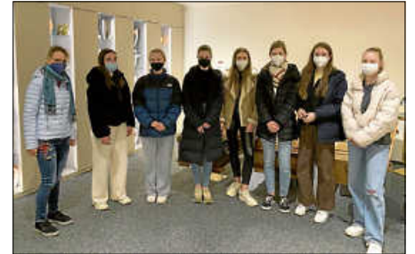
Die evangelische Gruppe der 10e im Bestattungsunternehmen Stier.

noch kurz den Chef des Bestattungsunternehmens kennenlernen durften. Alles in allem empfanden die Schülerinnen und Schüler den Tag als Bereicherung – trotz oder gerade wegen der Momente, die eine Saite in ihnen berührten, die in der Schule nur selten Raum hat. Vielleicht fällt es dem einen oder anderen jetzt leichter, über den Tod zu sprechen.