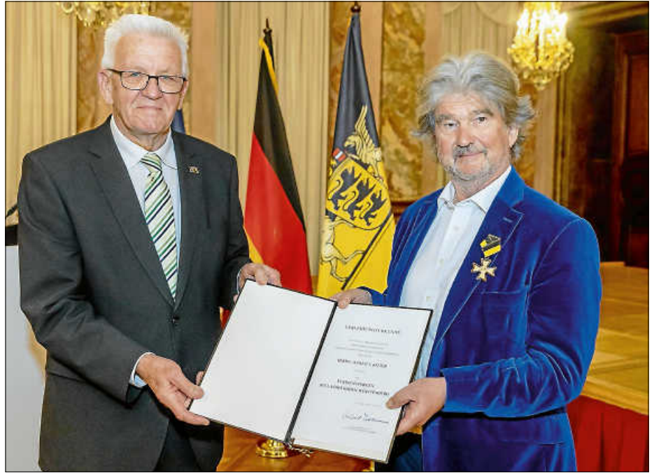
Mit dem Verdienstorden ausgezeichnet wurde Alfred Ritter von Ministerpräsident Kretschmann im Ludwigsburger Schloss.

„Es gehört seit Jahrzehnten zu unserer Tradition, jedes Jahr anlässlich des Geburtstages unseres Landes am 25. April Persönlichkeiten mit dem Verdienstorden des Landes Baden-Württemberg auszuzeichnen. In diesem Jahr feiert unser Land seinen 70. Geburtstag und wir können auf eine Erfolgsgeschichte zurückblicken, die wir insbesondere auch unserer unglaublich engagierten Bürgerschaft zu verdanken haben“, betonte Ministerpräsident Winfried Kretschmann am Samstag, 30. April, im Schloss Ludwigsburg anlässlich der Verleihung des Verdienstordens des Landes Baden-Württemberg.