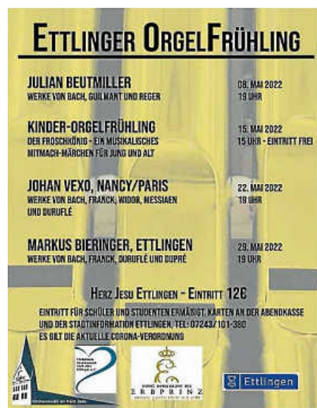
Plakat: Seelsorgeeinheit Ettlingen-Stadt

Karten sind zu 12 € (Orgelkonzerte außer Kinder-Orgelkonzert) im Vorverkauf bei der Stadtinformation oder an der Abendkasse erhältlich.