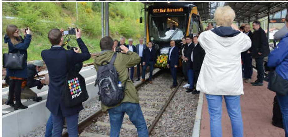
Großer Bahnhof für den Albtäler

pracht genießen im Rhododendronpark in Karlsbad, im Schatten der Klosterruine, dem Wahrzeichen des Albtals verweilen und zum Abschluss in Ettlingen an der Albmauer die Abendstimmung bei einem kühlen Getränk genießen oder im Schlosshof die Festspiele 'heimsuchen'.