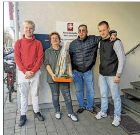
Übergabe an Herz-Jesu-Stift

der Wohnsitzlosen und Bedürftigen kaufen konnte. Seit Jahren unterstützt die UNESCO-AG das „Herz-Jesu-Stift“ in Karlsruhe mit diesem Einkauf. Glückliche Gesichter, nicht nur bei den Jugendlichen, waren zu sehen.