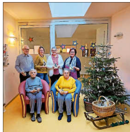
Weihnachtsfeier in der Kirchlichen Sozialstation Ettlingen

Das Feiern der Feste im Jahreskreis ist bei uns ein fester Bestandteil der Aktivierung. So feierten wir mit Unterstützung des Fördervereins auch Weihnachten. Die Gäste erhielten vom Förderverein kleine persönliche Geschenke, über die sich alle sehr freuten.