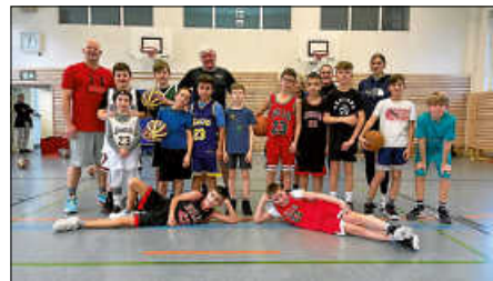
Fröhliche Gesichter beim Trainingstag der U12.

Mit der Rückrunde bereits am kommenden Wochenende in Aussicht spürte man die Vorfreude der Jungs auf die bevorstehenden Herausforderungen. Nach dem intensiven Training verließen sie die Halle zufrieden und erschöpft, mit einem einheitlichen Feedback: „So cool!“ Der Trainingstag war nicht nur lehrreich, sondern auch ein unvergessliches Erlebnis für alle Beteiligten.