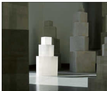
„Pecometer“, Installation von der Künstlerin Peco Kawashima

. und mir ist, als öffnet ein verwandter Geist mir die Arme ... *