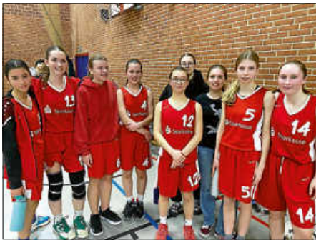
Die U16w beim Limfjordscup 2023

Einen ausführlicheren Bericht und weitere Bilder des Turniers findet ihr unter www.tsv-ettlingen.de