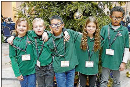
U10-Team SK Ettligen