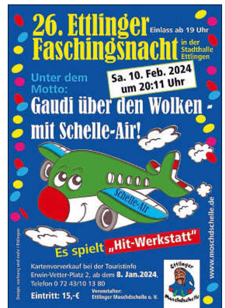
Plakat: Werbung und mehr

Karten sind bei der Touristinfo Ettlingen, Erwin-Vetter-Platz 2. Tel. 07243-101380 erhältlich.