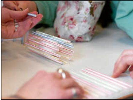
Gruppenaufgabe im Assessment-Center: Überlebt das Ei den Sturz aus zwei Metern Höhe?

Die Schülerinnen und Schüler zogen am Ende des Workshops ein positives Fazit: Man habe einen realistischen Eindruck bekommen, worauf es bei einer Bewerbung ankomme, viel Neues gelernt und vor allem auch von den zahlreichen Praxistipps profitiert. Auf jeden Fall fühle man sich jetzt vorbereitet. Die Zukunft kann kommen.