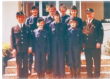
vor 40 Jahren