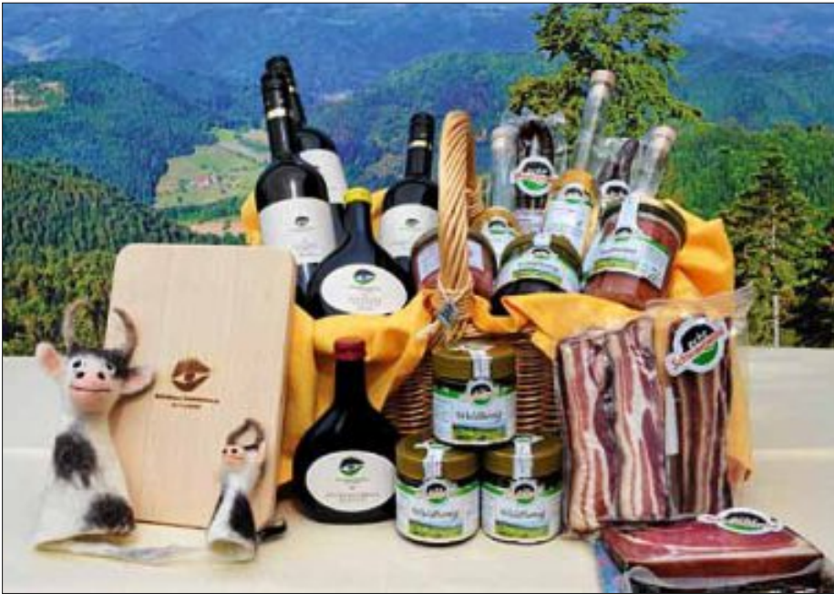
Essend die Kulturlandschaft Schwarzwald erhalten, kann man auf der Genussmesse am 22. September.