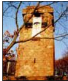
Majestätischer Bau für einen charismatischen Machtpolitiker: der Ettlinger Bismarckturm ...