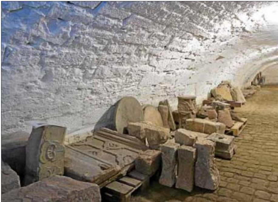
Ein Blick ins „Lapidarium“ des Museums. Der Begriff, der sich aus dem Lateinischen vom Wort für Stein, lapis , herleitet, bezeichnet eine Sammlung von steinernen Relikten, Skulpturen, Sarkophage, Grabsteine oder deren Bruchstücke.

Zum mittlerweile vierten Mal findet der landesweite Schlosserlebnistag statt, der in den vergangenen Jahren viele Tausende von Besuchern in die mittelalterlichen Burgen, barocken Residenzen und Schlösser des 19. Jahrhunderts überall im Land strömen ließ. Der Schlosserlebnistag am 15. Juni steht unter dem Motto „Keller, Gänge, Höhlen und Grotten“. Ein abwechslungsreiches Angebot bieten die einzelnen Schlösser, von Lesungen, Theater- und Ballettauführungen, über Führungen durch lauschige Gärten und geheimnisvolle Keller bis hin zu Chorbeiträgen.