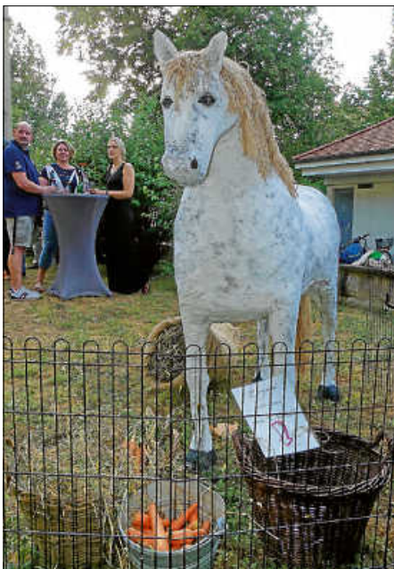
...sondern auch ein Überraschungsgast aus Pappmaché.