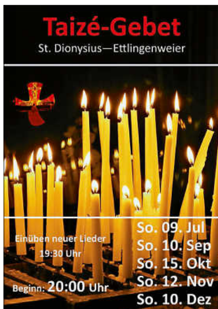
Plakat: W. Espe

Mit sehr erfreulichen 40-60 Teilnehmern bei den ersten beiden Terminen im Mai und Juni steht nun fest: Wir machen (gerne) weiter. Unser nächster Termin ist So., 9. Juli in der Barock-Kirche St. Dionysius/Ettlingenweißer , bevor es im August in die Sommerpause geht. Bis Jahresende folgen dann die weiteren Termine am 10.09., 15.10., 12.11. und 10.12. jeweils um 20 Uhr . Wer möchte, kann gerne schon um 19:30 Uhr kommen und mit uns die größtenteils mehrstimmigen Lieder einüben.