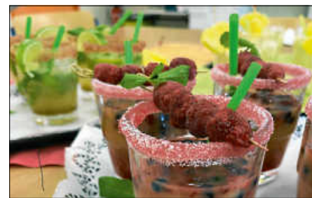
Alkoholfreie Cocktails aus unserer Schulküche (Klasse 2BFP1)

Diesmal selbst beim Einkaufen aktiv, begutachtete die Klasse zuerst einige Lebensmittel, verglich Preise von Markenprodukten mit No-Name-Produkten und kaufte am Ende selbst die Zutaten für die nachfolgende praktische Unterrichtsstunde ein.