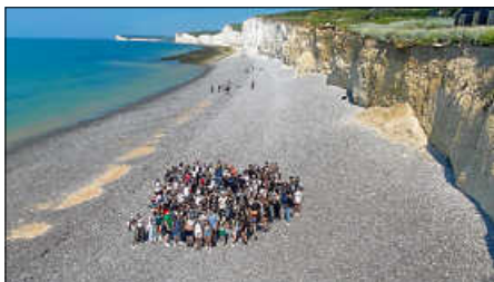
Klippenwanderung an den Kreidefelsen der Seven Sisters

Leider muss aber auch Platz sein für eine unerfreuliche Note, denn die Folgen des Brexit zeigten sich für das AMG sehr direkt: Nicht nur verlängern sich die Zoll- und Grenzformalitäten an der Fähre (5 Stunden Wartezeit!), sondern eine ganze Handvoll unserer SchülerInnen konnte nicht mitreisen, weil ihnen das nun nötige Visum verweigert wurde oder nicht rechtzeitig ausgestellt wurde. Wir hoffen auf eine ähnlich schöne Fahrt im nächsten Jahr – hoffentlich mit allen SchülerInnen des Jahrgangs.