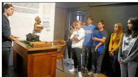
Die 9e in der Ebert-Gedenkstätte