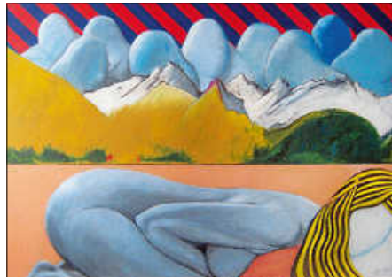
nH 102, Wachs und Ölkreide auf Papier, 270 cm x 100 cm, 2018.

Künstler eine Auswahl seines umfassenden Werkes – zahlreiche Bilder und Skulpturen aus der Schaffensperiode von über 45 Jahren. Zu der Ausstellung erscheint ein umfangreicher Katalog.