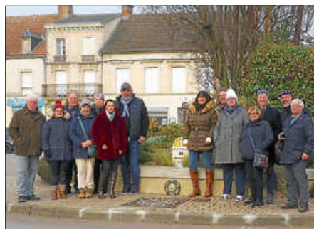
Komitees in Fère-Champenoise

Am 6. und 7. Mai 2023 feiern wir mit Fère-Champenoise das 60-jährige Bestehen der Partnerschaft in Bruchhausen. Die Vorbereitungen haben schon richtig Fahrt aufgenommen. Die Stadt- und Ortsverwaltung, das Komitee für die Partnerschaft, die Feuerwehr und viele Bruchhausener Vereine