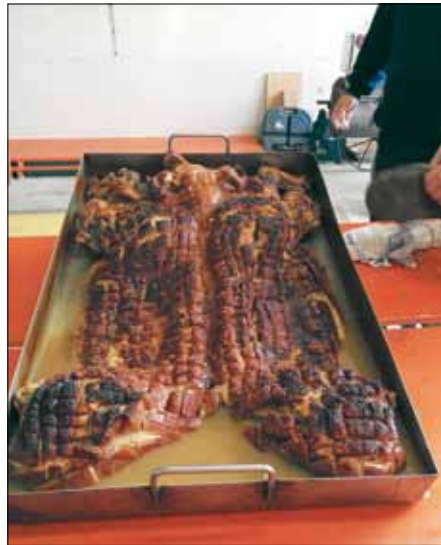
Rundum knusprig - einfach lecker!

Schließlich fand bei gemütlichem Zusammensein und netten Gesprächen ein rundum gelungener Abend sein Ende - jedoch nicht ohne das vielfache Versprechen, im nächsten Jahr wieder dabei zu sein.