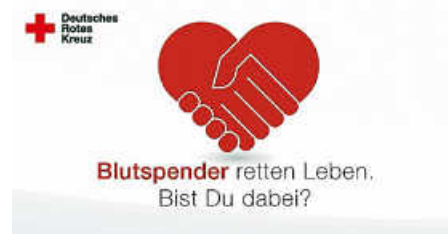
Plakat: DRK Blutspendedienst

Durchschnittlich drei Prozent der Bevölkerung spenden regelmäßig Blut. Dabei wird Blut täglich zur Behandlung von Patienten in Krankenhäusern benötigt. Insbesondere in den Sommermonaten zur Urlaubszeit sind die Reserven gering. Jetzt Blutspenden und Leben schenken! Schon jetzt den nächster Blutspendetermin im Kalender eintragen!