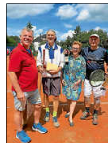
Sieger H 65