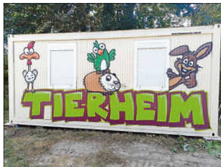
Container Tierheim

Nun hat uns der Wieslocher Künstler Marco Billmaier, von „Die Wandgestaltung“, den Container mit Graffiti-Schriftzug und Comictieren gestaltet. Als Hingucker soll er mit seinen glücklichen Gesellen unseren Besuchern Freude bereiten, auch wenn dabei nicht vergessen werden darf, dass den Schützlingen des Tierheims das Glück bisher oft nicht vergönnt war.