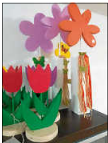
Wir basteln Sommerdeko

Am 15. Juli 2023 besteht wieder die Möglichkeit diese Dinge von 10–11:30 Uhr im Kindergarten-Keller in der Hohlstraße 29, Spessart, abzugeben.