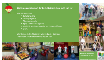
Plakat: Erich Kästner- Grundschule

Der derzeitige Vorstand hat im neuen Schuljahr 23/24 nur noch einen aktiven Elternvertreter an Board, um es einmal ganz deutlich zu sagen. Engagieren Sie sich hier im Dorf, für Ihre Kinder und für deren Zukunft. GEMEINSAM können wir viel erreichen.