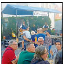
Touchwood in Aktion

Wohl bekomm` s wünschen wir heute schon.