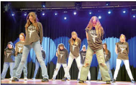
Tanzmedley des Ateliers Francis