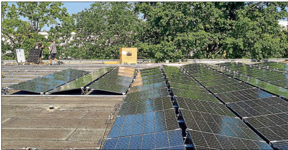
Eine von drei Photovoltaikanlagen, die die BEG 2022 realisierte, ist die Anlage auf dem Dach des Eichendorff-Gymnasiums mit einer Leistung von 135 Kilowatt Peak.