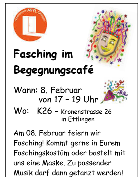
Plakat: J. Garcia Jester