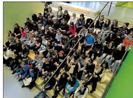
Alle Preisträgerinnen und Preisträger des Wettbewerbs „Chemie im Alltag“

Die Preisträgerinnen und Preisträger, ihre Begleitpersonen und die Lehrkräfte durften als Teil der Siegerehrung einen spannenden Film über die Entstehung des Universums anschauen (vom Urknall bis zur Entstehung eines Sterns).