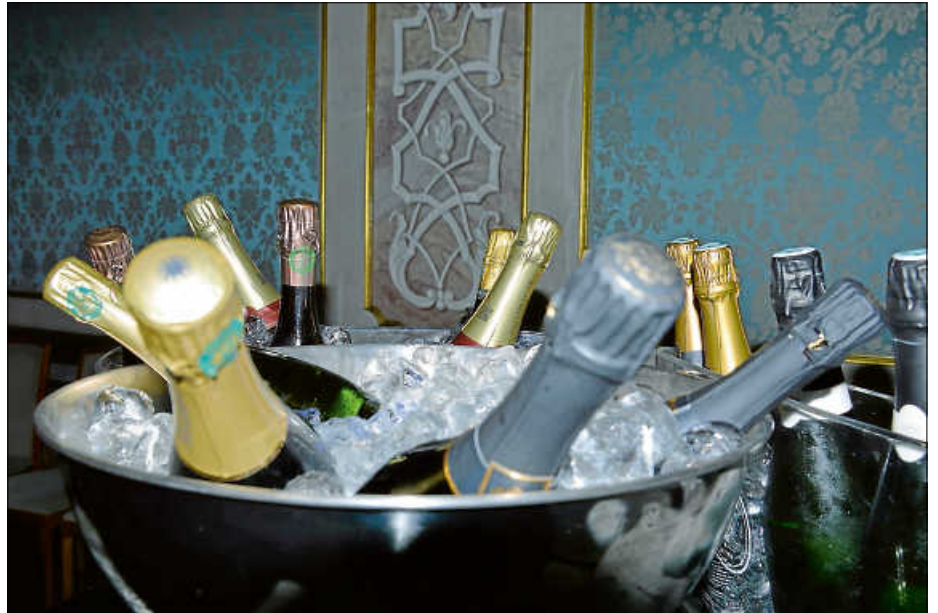
Das Gold der Marne fließt wieder vom 12. bis 14. April in der Schlossgartenhalle.

Es ist ein Fixpunkt im Frühjahrskalender: das Champagnerfest. Zum achten Mal heißt es vom 12. bis 14. April Bühne frei in der Schlossgartenhalle für das Gold der Champagne. Sieben Winzer Charbaut, Derouillat, Gonet, Hennequin, Jacquinet, Rogge-Cereser, Salmon, aus der Region rund um Ettlögens Partnerstadt Epernay präsentieren am Samstag und Sonntag ihre edlen Tropfen.