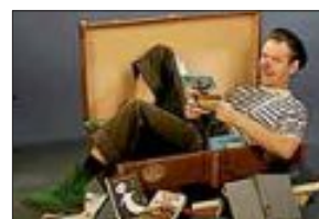
„Dido liest“ Wenn Clown Dido liest...erlebt er viele Abenteuer.

Ein besonderer Lese- und Mitmachspaß rund um Kinderbücher, Buchstaben, Worte, Verse und Reime Clowntheater für Kinder ab 5 Jahren und ihre Eltern, Großeltern und alle Kinderbuchfreunde Eintrittskarten: 2,50 Euro Vorverkauf in der Stadtbibliothek, Tel: 101-207