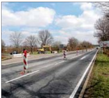
Bis Ende der Woche wird die Baustelle auf der Landstraße zwischen Ettlingen-Bruchhausen fertig sein, wenn das Wetter mitspielt.

Die Fahrzeuge aus Bruchhausen, in Richtung Ettlingen fahrend, werden über die B 3 umgeleitet. Eine Umleitungsbeschilderung ist eingerichtet. Nur Busse dürfen die Strecke nach Ettlingen fahren! Nach Ende der Osterferien läuft dann der Verkehr wieder in beide Richtungen. Die Stadt hofft dabei auf eine gute Witterung und bittet um Verständnis für die Einschränkungen und Behinderungen während der Baumaßnahme. Weitere Auskünfte erteilt das Stadtbauamt unter 0 72 43/1 01-4 18 oder stadtbauamt@ettlingen.de.