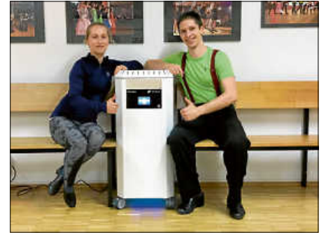
Virenfrei trainieren im TSC Sibylla

sicht beibehalten, dann können wir vielleicht nach Ostern auf weitere Öffnungen hoffen. Informationen darüber gibt es wie immer hier im Amtsblatt oder auf unserer Vereinsseite unter www.tsc-sibylla.de .