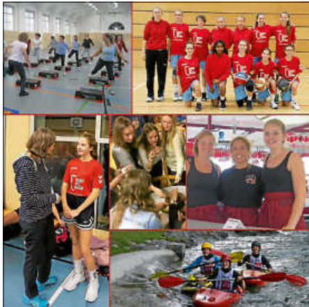
Frauen beim TSV Ettlingen

Das Anmeldeformular steht unter www.tsv-ettlingen.de zum Download bereit.