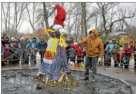
Gatschina feiert mit brennender Stroh puppe Ende des Winters

Traditionell werden in dieser Zeit besonders viele Blinis, russische Pfannkuchen, gegessen. Sie sind als fleischlose Kost zur Einstimmung auf das rund anderthalb Monate lange Fasten bis zum Osterfest gedacht. Dieses Jahr feiert die russisch-orthodoxe Kirche Ostern am 2. Mai, da sie dem alten julianischen Kalender folgt.