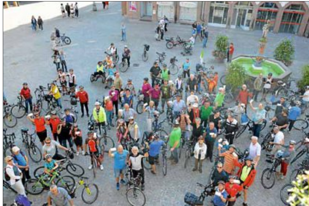
Rund 150 Radlerinnen und Radler nahmen im vergangenen Jahr an der Auftakttour teil.

Startschuss zum Klimaschutz-Wettbewerb STADTRADELN fällt