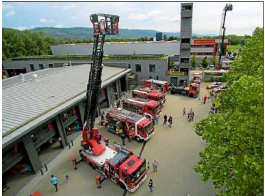
Blick von der Drehleiter aufs Feuerwehrgerätehaus.