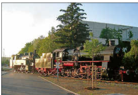
75 und 58 in der Abendsonne ...

Bitte beachten: 9-€-Tickets haben in den Sonderzügen keine Gültigkeit, dafür gibt es aber preiswerte Kombi-Billets. Diese Kombi-Billets ermöglichen die Mitfahrt in allen Pendelfahrten ab Amstetten (nicht in den Zubringer-Sonderzügen) und können bereits im Vorfeld im Online-Verkauf oder aber auch vor Ort erworben werden. Der Kauf dieser Fahrkarten finanziert den Erhalt und Betrieb der wertvollen Museumsstücke!