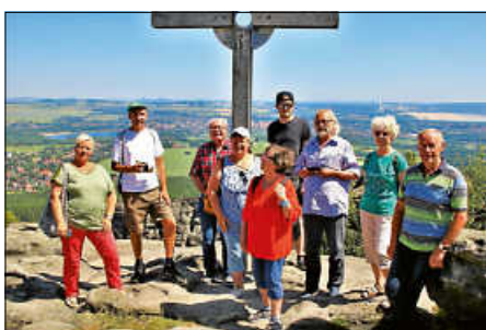
Auf dem Töpfer

Besuch bei den Naturfreunden in Löbau. Endlich war es so weit, auch die Naturfreunde aus Löbau konnten wir wieder besuchen!