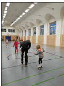
Rollkunstlauf Stufe 2

Rollschuhe an, fertig, los ... Stufe 2 war zu Gast beim RSV Ettlingen und konnte das Rollschuhfahren in der Halle ausprobieren. Für viele Kinder war es das erste Mal auf Rollschuhen und dafür haben sich die Kids echt super geschlagen.