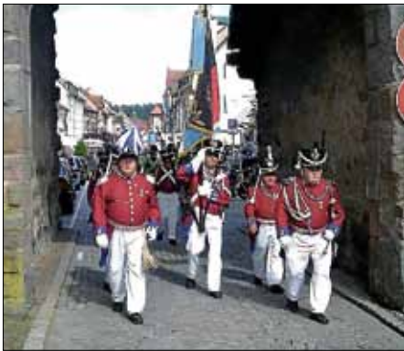
Bürgerwehr Ettlingen am Riedtor in Villingen beim Landestreffen (Bericht siehe Ausgabe 31).