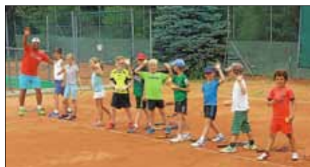
Viel los beim Jugend- und Kindersommercamp des TC Ettlingen