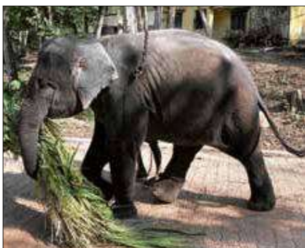
Ein Elefant bei der Arbeit

Vor der kompletten Unter- und Mittelstufe hielten in der Mensa einige Schülerinnen und Schüler der 11 e und f einen Vortrag über die letzte Indienreise der drei Heisenberg-Gymnasien, die im Februar stattgefunden hatte. Sie zeigten Fotos und berichteten von ihren Renovierungsarbeiten an den Gebäuden unserer Partnerschule, den Begegnungen mit den Kindern in Mitraniketän und den Ausflügen. Vieles war fremd und exotisch, z.B. das Essen, die Kleidung und das Duschen mit einem Wassereimer, aber alle sind an Erfahrungen reicher zurückgekommen. Man konnte die Begeisterung spüren und sicher werden viele der jüngeren Schülerinnen und Schüler eines Tages auch mit nach Indien reisen, um die Arbeit weiterzuführen.